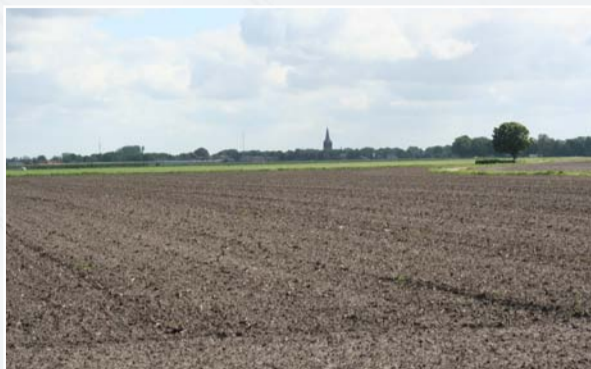
Grote Veld, met zicht op kerk van Zaerum en Kruusboeëm

Rond de clusters van oude boerderijen in buurtschappen en de linten boerderijen langs wegen, ontstonden de oude bouwlanden. De van oorsprong magere zandgronden zijn door eeuwenlange bemesting vruchtbaar gemaakt en opgehoogd. De grootste oude bouwlanden zijn Grote Veld en Luttelse Veld. Kleiner zijn Rouweelseveld en Vorsterveld. Met hun bolle ligging en openheid zijn dit zeer karakteristieke landschappen.