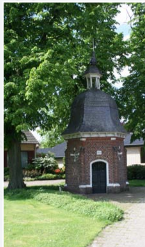
Kapel Den Eigen