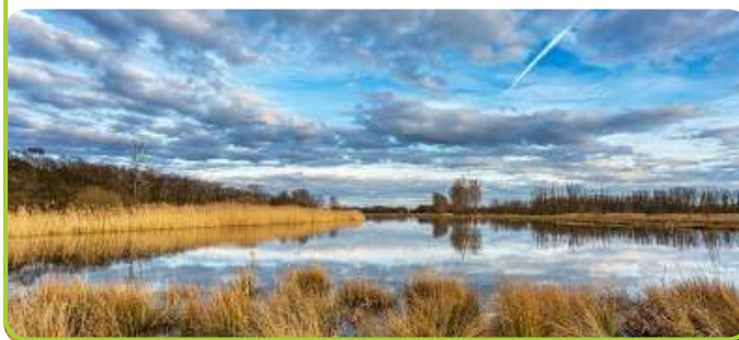
De oude Maasarm

Meer informatie? Neem contact op met René Colbers: +31(0)6 133 28 758 of rene@colbers.nl