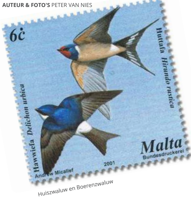
Huiszwaluw en Boerenzwaluw