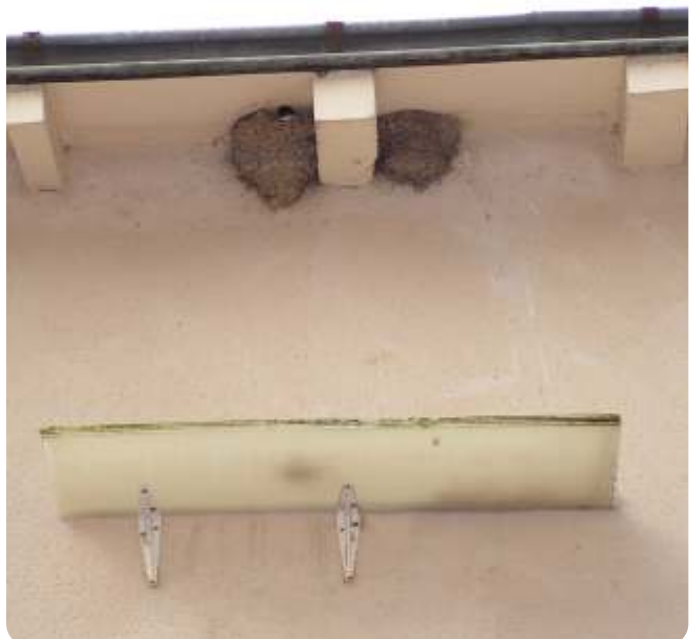
plankje onder het nest

Als het bolvormige nest, dat geheel is opgebouwd uit bolletjes klei en mest vermengd met speeksel en een enkel grassprietje klaar is, worden er 4 tot 5 witte eitjes gelegd. Zowel het vrouwtje als het mannetje bebroeden de eieren. Naarmate de tijd verstrijkt vertonen de eieren steeds meer vlekjes. Na ongeveer twee weken komen deze uit* en na nog eens drie weken vliegen de jongen uit (*zie foto op