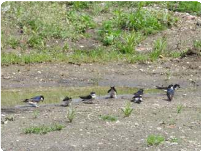
Modder of leem vinden.

Sinds de 70er jaren is hun aantal drastisch teruggelopen van 250-450.000 broedparen naar 85-120.000 broedparen (Sovon 2018-2020), reden waarom hij op de Rode Lijst is geplaatst. De oorzaken voor deze afname zijn niet geheel duidelijk, en daarom volgt Sovon inmiddels al sinds een jaar of twintig de ontwikkeling van de kolonies wat intensiever. Ikzelf tel nu ook al meer dan twintig jaar de kolonies in enkele woonkernen van de gemeente Venlo. Daarbij heb ik kunnen vaststellen dat er meerdere redenen zijn waardoor kolonies kunnen groeien dan wel afnemen (zie het artikel op pagina 14). Het is voor de vogels moeilijker geworden om goed nestmateriaal zoals modder of leem te vinden .