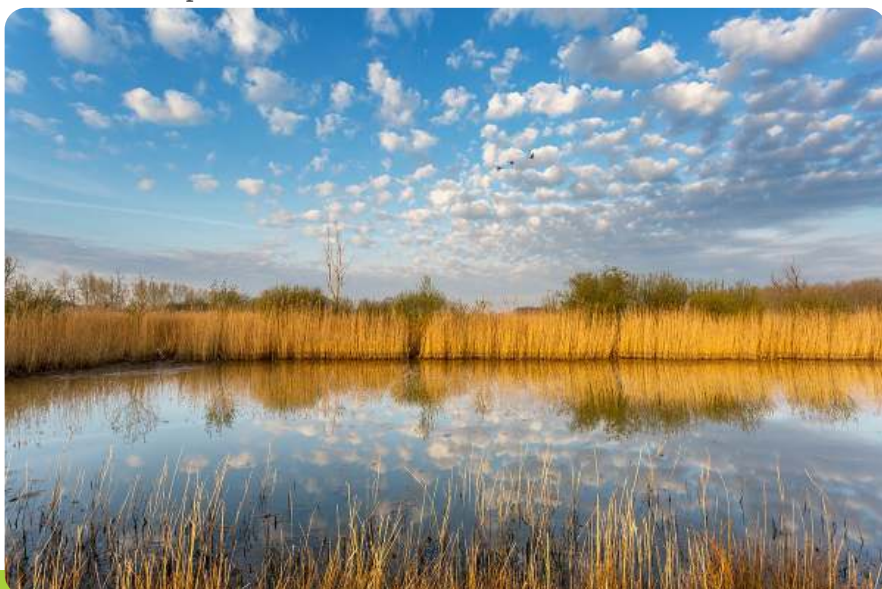
IVN De Maasdorpen