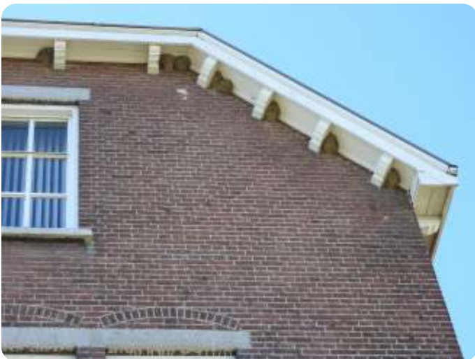
Deel van de huiszwaluwkolonie op het kazerneterrein in Blerick

Ik woonde toen sinds kort in Venlo en ik had gezien dat er op de Vleesstraat een drietal nesten op een winkelpand aanwezig waren. De betreffende bewoner had er stevige plankjes onder bevestigd waardoor er voor de argeloze passanten geen overlast zou kunnen ontstaan. Ik vond dat een mooi gebaar en was benieuwd of er binnen de gemeente nog meer nesten aanwezig waren. Ik vond er in Boekend en in Hout-Blerick; een jaar later ook op het kazerneterrein in Blerick en nog een jaar later ook nog aan de Weselse Barrière en in het buitengebied van Hout-Blerick. Daarmee had ik in totaal zes kolonies die ik tot mijn verantwoordelijkheid mocht rekenen.