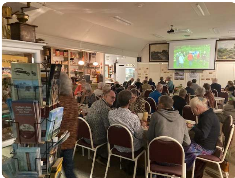
Impressie van de feestzaal