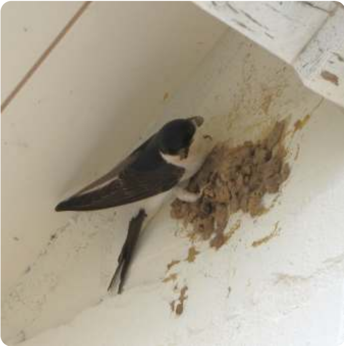
Starten met herstellen of met een nieuw nest