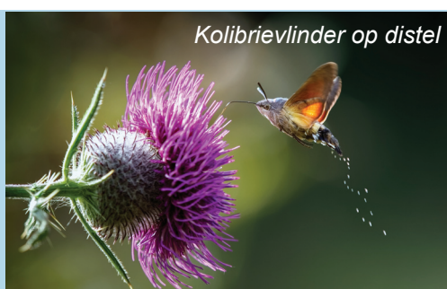
Kolibrievlinder op distel